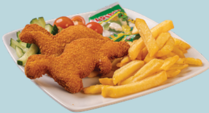
DINO NUGGETS mit Pommes