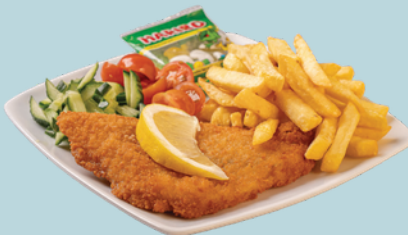
SCHOLLENFILET mit Pommes