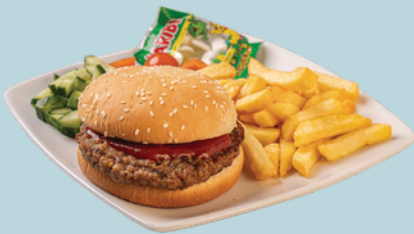
KINDERBURGER mit Ketchup und pommes