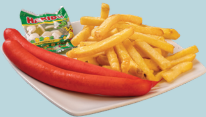
ROTE WÜRSTCHEN mit Pommes